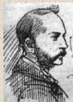
Inspecteur Frederick Abberline

L a victime du crime abominable commis dans la nuit du 25 au 26 août vient d'être identifiée : il s'agit de Miss Laura Visemount, une prostituée de Whitechapel aussi connue dans les rues sous différents sobriquets que la décence nous interdit de reproduire ici. Rappelons qu'elle a été tuée et mutilée de façon particulièrement abominable, rappelant avec force les meurtres épouvantables de Jack l'Éventreur, cinq ans plus tôt. C'était une femme d'âge moyen, que plusieurs personnes décrivent comme ayant pâti de mœurs relâchées et de revenus limités. Miss Visemount, sans emploi déclaré, vivait semble-t-il de ses charmes. Elle aura passé ces dernières semaines en dormant sporadiquement dans un asile de nuit de Bucks Row , les nuits où elle pouvait s'en offrir le maigre loyer. Des connaissances déclarent l'avoir vue pour la dernière fois au Couch and Four , un pub de Commercial Road , à environ 23h30 le soir avant que son corps ne soit découvert. Un témoin la décrit comme ayant été « d'humeur massacrant, médissant sur tout le monde, comme d'hab' ». Elle était manifestement dans un état d'ébriété avancé, et quitta les lieux en marmottant quelque chose au sujet d'un rendez-vous. Personne n'a rapporté l'avoir vue avant que son corps mutilé ne soit retrouvé à 3h30 le matin suivant par l'agent de police John Watkins de la Metropolitan Police , alors qu'il effectuait sa patrouille.